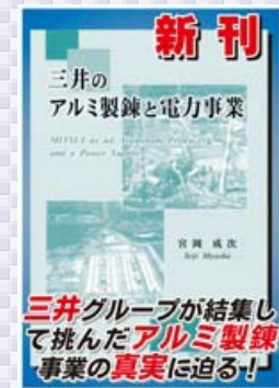
三井グループが結集して 挑んだアルミ製錬 事業の真実に迫る！